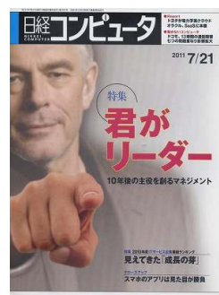
日経コンピュータ