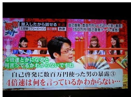
暴露ナイト (テレビ東京)