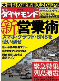
週刊ダイヤモンド