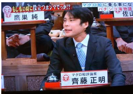
ホンマでっか!? TV (フジテレビ)